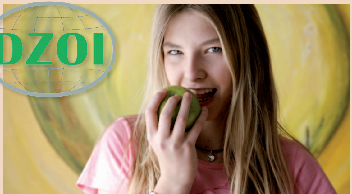
Oft haben Kinder jahrelang Schmerzmittel eingenommen, bevor ihr Leidensweg durch kieferorthopädische Behandlung ein Ende nimmt.

Auch in unserer Praxis vergrößert sich zunehmend die Anzahl der davon betroffenen Patienten. Ihre Leidensgeschichten sind sehr unterschiedlich. Die meisten Kinder wurden von ihrem Hausarzt mit der Erklärung Migräne oder einer Neigung zu Kopfschmerzen schon jahrelang ausschließlich mit Schmerzmitteln behandelt, ohne dass sich an der Häufigkeit der Schmerzzustände etwas änderte. Vermehrte Fehltag in der Schule und mangelnde Leistungsfähigkeit begleiteten ihren Weg. Ein unruhiger Schlaf mit längeren Wachphasen war eher die Regel als die Ausnahme. Bei anderen war das Leit-